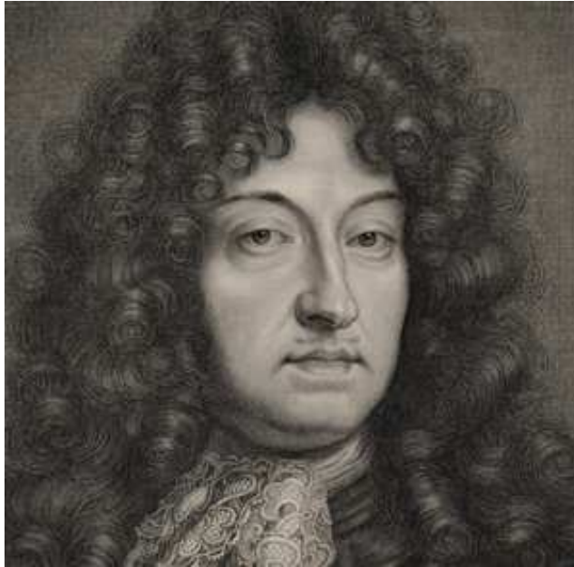
Un des nombreux portraits gravés de Louis XIV. par P. Vandebroc, 1685.