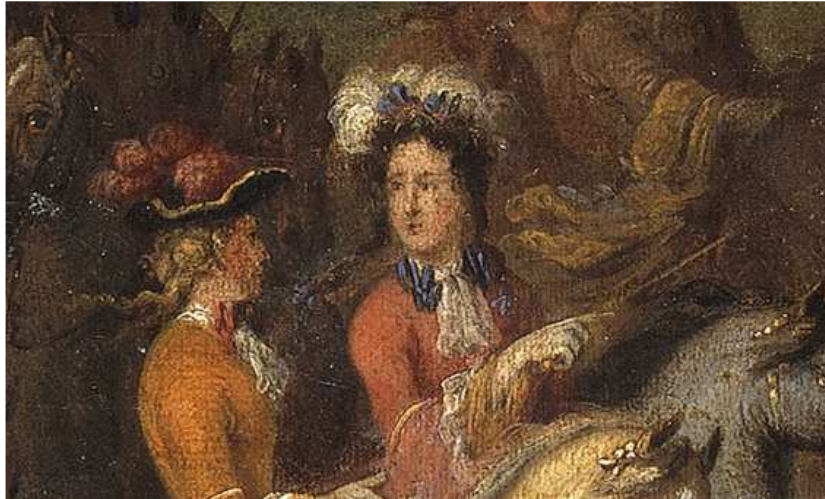
Détail sur le visage du personnage féminin.

Pourrait-on reconnaître d'autres personnages ? Nous pensons répondre positivement, en examinant le personnage féminin, jusque là pris pour ... la duchesse de Bourgogne. Mais cette assertion ne tient plus, puisqu'on voit mal la duchesse de Bourgogne, Marie-Adélaïde de Savoie (1685-1712) participer à une chasse à Meudon en présence de Louvois vers 1685, quand à cette date, celle-ci naissait à peine (sic), et n'arrivait à la Cour de France depuis sa Savoie natale que dix ans plus tard !