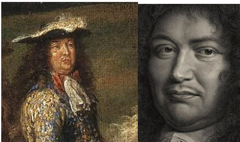
Comparaison des deux portraits : la ressemblance concorde bien mieux.