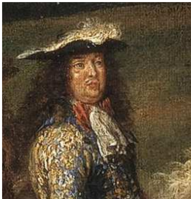
Détail du visage dit « du Roi » de notre peinture.

Dans ce cas, qui est représenté sur la toile ? La réponse est assez aisée en vérité. On y reconnaît à l'évidence le ministre de Louis XIV, Louvois , qui justement a été propriétaire de Meudon de 1679 à 1691 ! C'est donc que le peintre a représenté non pas « Louis XIV et sa Cour », mais bien « Louvois et sa Cour ». On obtient ainsi la représentation d'une partie de chasse d'un ministre et de sa « mini-cour » qui l'accompagne, sujet représenté de manière beaucoup plus rare que la Cour du Grand Roi. Ce qui rend cette toile d'autant plus passionnante. Ainsi, nous pouvons corriger la datation de la