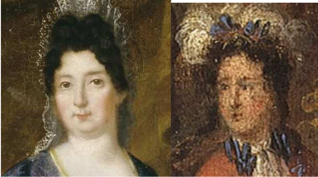
Comparaison des deux portraits : la ressemblance concorde.