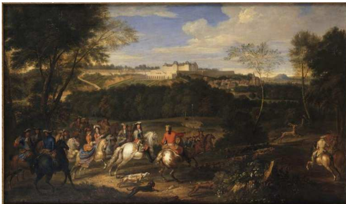
Tableau intitulé jusqu'à nos jours : « Louis XIV et la Cour chassant en vue du château de Meudon » Musée de Versailles, MV 5630