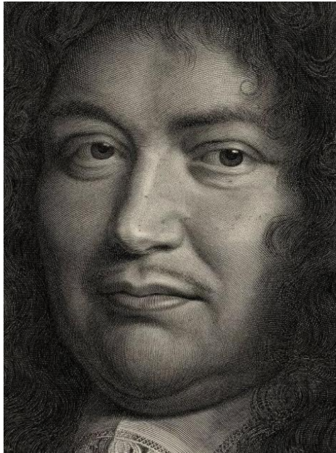
Détail du portrait de Louvois par Robert Nanteuil, 1677.

représentation de cette peinture, non pas entre 1695 et 1700, mais entre 1679 et 1691.